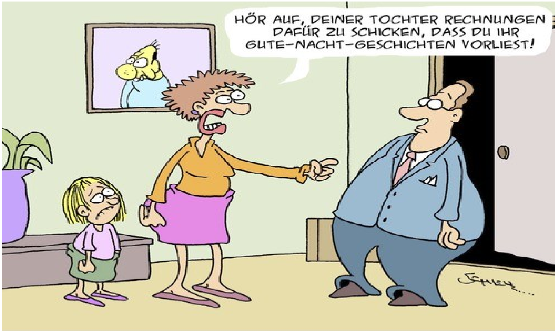
DER RECHTSANWALT UND SEINE FAMILIE